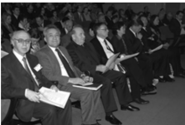
The participants of the Plenary Session of the Conference Участники пленарного заседания конференции

The organizers of the conference jointly with the All-Russian Distance Institute of Finance and Economics (ARDIFE) and VEO of Russia were: Ministry of education and science of the RF, Russian Academy of Natural Sciences, Academy of economic sciences and entrepreneurship of Russia, American Institute of business and economics (the USA), Donetsk National University (the Ukraine), Kazakh national University named after al-Farabi (the Republic of Kazakhstan), Central University of finance and economics of China (the People’s Republic of China), Publishing house “Economic Newspaper”. The informational partners became the weekly “Economic and life” and Research Institute of merchandise and market of the wholesale market.