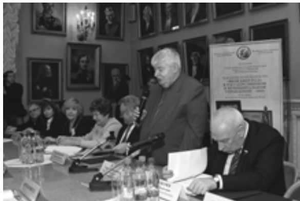
G.Kh. Popov speaks Выступает Г.Х. Попов

23 декабря 2010 года в Москве в Доме экономиста состоялась торжественная церемония награждения победителей IV Российского конкурса “Менеджер года в государственном и муниципальном управлении – 2010”.