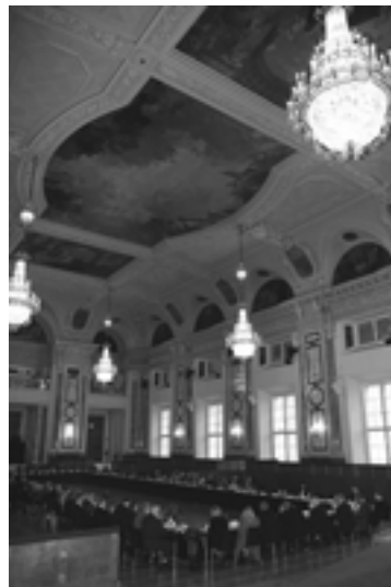
Plenary Session of the XX Anniversary Meeting of the International Union of Economists (Hofburg Palace, Vienna) Пленарное заседание XX юбилейного Собрания Международного Союза экономистов (дворец Хофбург, г. Вена)

Юбилейное Собрание организовано Международным Союзом экономистов совместно с Правительством Москвы и Магистратом Вены при поддержке Экономического и Социального Совета ООН.