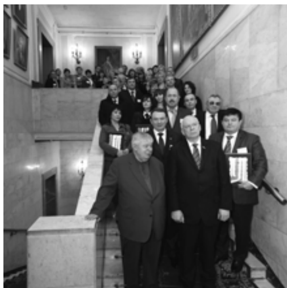
Traditional photo Традиционное фото на память

The full information about the competition and winners lists are published in the brochure “Winners of the Russian competition “Manager of the year in state and municipal management – 2009”, in the newspaper “Economic news” and placed on the site on http://www.uecon.org .