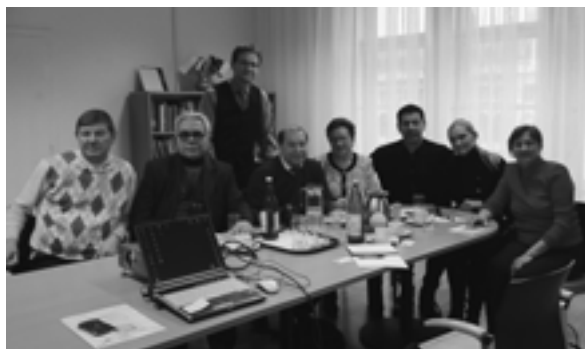
The participants of the Meeting with the representatives of “E-government” Встреча участников Собрания с представителями АО “Электронное правительство”

В рамках программы XX юбилейного Собрания также были проведены деловые встречи, дискуссии, круглые столы. Участники Собрания посетили рекомендованные Магистратом Вены предприятия городского хозяйства: ENERGYbase, АО “Электронное правительство”, “Организация городского самоуправления”, “Дом Энергетики г. Вены” и “Винер Линиен”, в работе которых применяются инновационные технологии.