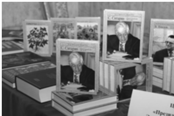
The books by S.A. Sitaryan "The lessons of future" Презентация книги С.А. Ситаряна "Уроки будущего"

Е.М. Примаков – президент Торгово-промышленной палаты Российской Федерации, академик РАН, почетный академик Международной Академии менеджмента, д.э.н.;