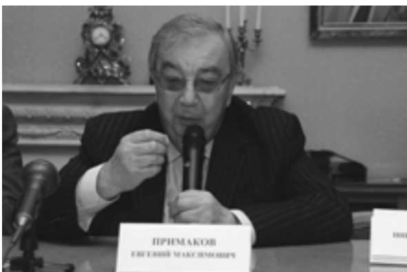
E.M. Primaakov speaks Выступает Е.М. Примаков

The presentation of the book "The lessons of future" of the publishing house "Economic newspaper" took place at the Round table. This book contains the last unfinished work by Stepan Aramaisovich about the experience of economic reforms of eighties of the XX century. There are also some extracts from the scientific transactions and recollections of the colleagues and friends in the book.