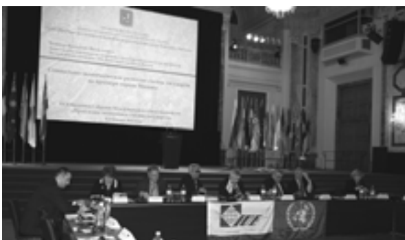
Presidium of the Plenary Session Президиум пленарного заседания