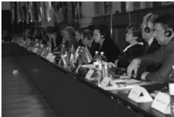
The participants of the Plenary Session Участники пленарного заседания

Участников Собрания с 20-летием деятельности МСЭ поздравили вице-президенты Международного Союза экономистов, которые не смогли присутствовать на пленарном заседании: С. Рока (Королевство Испания); Д.С. Нг (Китайская Народная Республика); К. Мегрелис (Французская Республика), В.И. Щербаков (Российская Федерация).