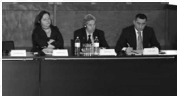
The participants of the Plenary Session – representatives of the Magistrate of the City of Vienna Участники пленарного заседания – представители Магистрата г. Вены