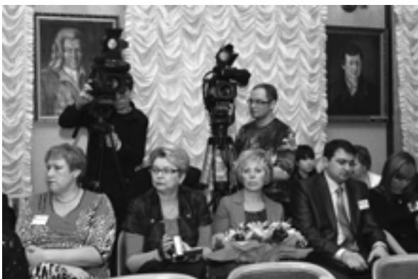
Winners of the Russian Contest Победители Российского конкурса

Head of the local administration of the city okrug Prokhladny, the Kabardino-Balkaria Republic