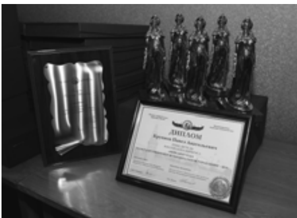
Awards of the Russian Contest "Manager of the year in state and municipal management" Награды Российского конкурса "Менеджер года в государственном и муниципальном управлении"

The results of the contest of this year reflected the most urgent trends of the state's development. The largest number of participants was noted in the nominations that represented the social and financial-economic spheres, regional programs' development and agriculture.