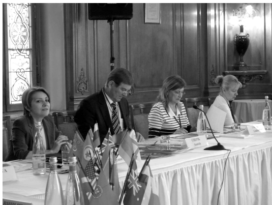
The participants of the Plenary Session Участники пленарного заседания

Traditional, spring congress of the International Union of Economists took place for the 16th time in Montreux (Switzerland) and lasted from April 24 till April 29, 2011. The plenary meeting was dedicated to the theme: "World Economy: 20 Years of Post-Industrial Development of the Former Socialist Countries".