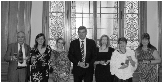
Participants of the Congress Участники Конгресса

is based on the duality theory which summarizes Keynes's Theory and the theory of monetary policy. The economic duality theory allows managing market equilibrium at the industry, employment and income levels, including the "price" of the national currency itself; and putting this theory into practice makes it possible to improve applied instruments used in managing macroeconomic dynamics and to develop sound competition between enterprises.