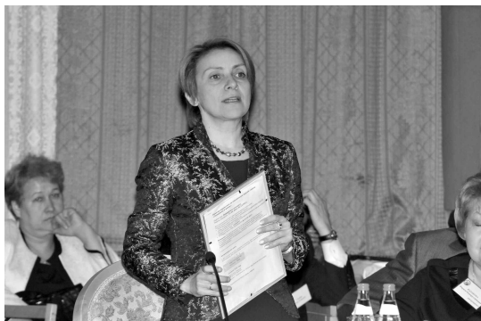
Awarding the prize from the information sponsor — the weekly "Business and Life" Вручение приза от информационного спонсора еженедельника «Экономика и жизнь»