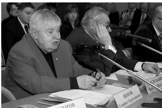
G. Kh. Popov speaks Выступает Г.Х. Попов

G.Kh. Popov — President of VEO of Russia, IUE President, President of the International University, President, Honorary Full Member of the International Academy of Management, RANS Academician, Dr. Sc. (Econ.), professor — presented the key report on the theme: “When Millions of Russian Slaves Became Free” . He indicated the main topic of the Plenum — the necessity of modernization in Russia based on the experience of past generations in it. In his point of view, the most successful modernization in Russian history is considered to be the reforms implemented by Aleksandr II and as their result — abolition of serfdom in 1861 "when millions of Russian slaves became free" people! But the reforms of the tsarist government were not finished and — as G.Kh. Popov observed — the reasons for three Russian revolutions rooted right in the implementation of these reforms: there is a good reason to suppose that in case of a consecutive and successful implementation of the reforms the revolutions would not have taken place. Therefore, the modern society should study and analyze the experience of the Great Reforms, and there is also a significant demand in the reformers who are ready to carry out the required transformations.