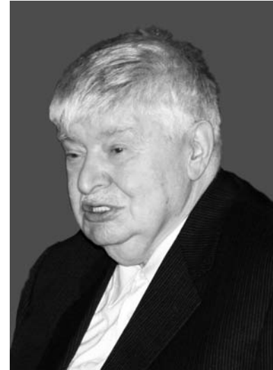
G.Kh. Popov is giving his speech Выступает Г.Х. Попов

On December 10, 2014 , the Round Hall of the President Hotel in Moscow hosted a Plenary Session of the Board of the Free Economic Society of Russia devoted to preparation for the 250th anniversary of the Free Economic Society of Russia.