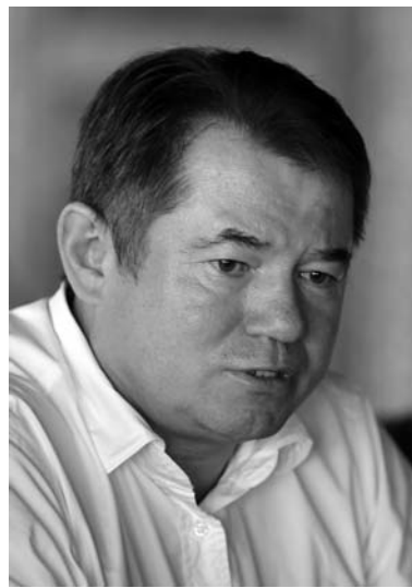
S.Y. Glaziev is giving his speech Выступает С.Ю. Глазьев

Мы живем в век глобализации, когда господствует мировой международный капитал, который на деле на 80% — американоцентричный капитал от американских корпораций. И, соответственно, глобализация принимает форму экспансии капитала, связанного с транснациональными корпорациями и эмиссионными центрами — Соединённые Штаты, Федеральная резервная система, Европейский союз, зона евро с Европейским центральным банком.