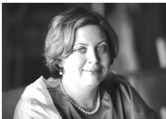
A.V. Sadovnichaya is giving his speech Выступает А.В. Садовнича

An important prerequisite to the development of integration processes is the establishment of a common power market and unified transport space among the EEU member countries. With due account for the significant raw materials constituent in the structure of trade and economic exchanges, there is an acute problem of switching cooperation between the EEU member countries to the new principles of economic interaction that are expected to result in the intensified cooperation and growing competitiveness of national enterprises.