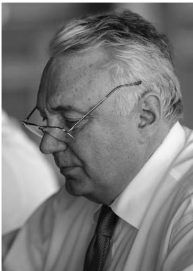
O.N. Soskovets is giving his speech Выступает О.Н. Сосковец

of the Economics and Spirituality Russian Classical Library, Vice President of the Free Economic Society of Russia, RF Honored Scientist, Dr. Sc. (Econ.), Professor analyzed the processes of economic integration in the conditions of world economy globalization against the background of economic development problems in Russia that is now exposed to economic sanctions and restrictions in his report on the topic: Globalization. Integration. Russia.