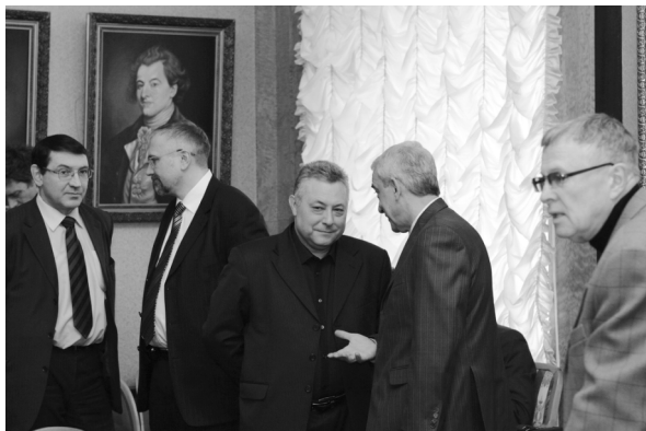
Before the beginning of the meeting. Participants of the Round table Перед началом заседания. Участники Круглого стола