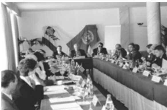
The V International Congress on Regional Development (Crans-Montana, Switzerland) V Международный конгресс по региональному развитию (Кран-Монтана, Швейцария)

– V Международный конгресс по региональному развитию. Тема: “Проблемы развития страхового рынка России и стран СНГ” (март; Кран-Монтана, Швейцария)