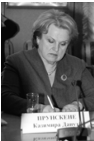
K.D. Prunskene, ex-Prime Minister of the Republic of Lithuania К.Д. Прунскене, экс-премьер-министр Литовской Республики

– World HABITAT day. Theme: “Better city – better life” (October; Moscow, Russia)