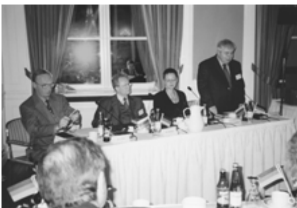
The German-Russian Round Table (Hamburg, Germany) Германо-российский круглый стол (Гамбург, Германия)