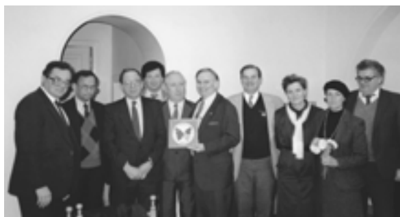
Signing the agreement on the establishment of joint venture "Amskort International" Подписание соглашения о создании СП "Амскорт Интернэшнл"

– Создание совместного предприятия "Амскорт Интернэшнл" (СССР – США) (СП вошло в первую пятерку зарегистрированных совместных предприятий)