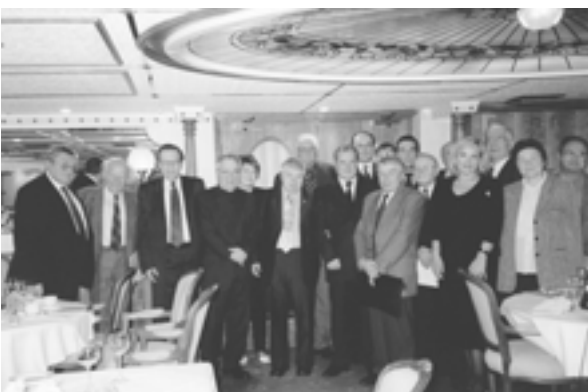
The XII Annual Meeting of the IUE members (Hungary). Round table XII ежегодное Собрание членов МСЭ (Венгрия). Круглый стол

– International conference “Russia and central Asia: problem of water and strategy of cooperation” in the framework of the Year of sweet water, announced by the UN (April; Moscow, Russia)