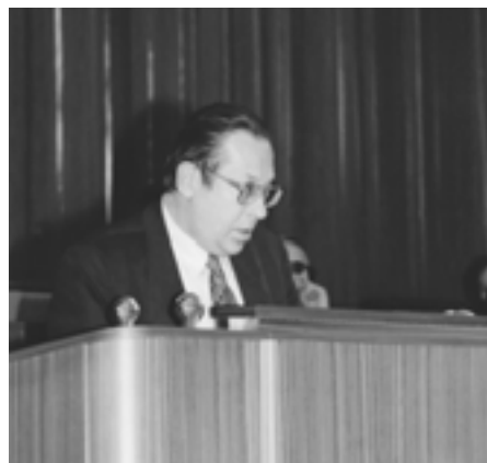
The International Forum (Moscow State Kremlin Palace). A speech by the academician of the Russian Academy of Sciences L.I. Abalkin Международный форум (Москва, Государственный кремлевский дворец). Выступление академика РАН Л.И. Абалкина

– В рамках международного форума “Мировой опыт и экономика России” : II Всероссийский форум “Стратегия экономического развития России – шаг в XXI век” (ноябрь; Москва, Россия)