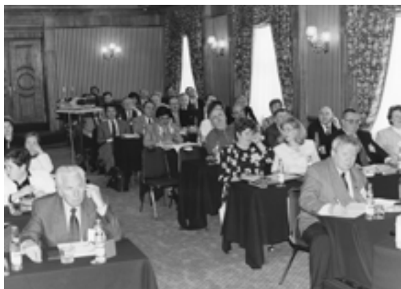
At the International conference (Santiago-de-Chile, Chile) Международная конференция (Сантьяго-де-Чили, Чили)