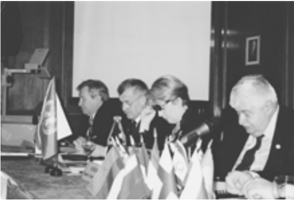
The VIII International Congress on Regional Development. On the right: IUE President – G.Kh. Popov , next to him – E.V. Mitrofanova (Deputy Director General of UNESCO) VIII Международный конгресс по региональному развитию. Справа: Президент МСЭ Г.Х. Попов , рядом: Э.В. Митрофанова (заместитель генерального директора ЮНЕСКО)