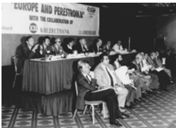
The International Colloquium (Brussels, Belgium) Международный коллоквиум (Брюссель, Бельгия)

– International colloquium "Economic reform of USSR and prospect of the East – West cooperation" (June; Brussels, Belgium; Paris, France)