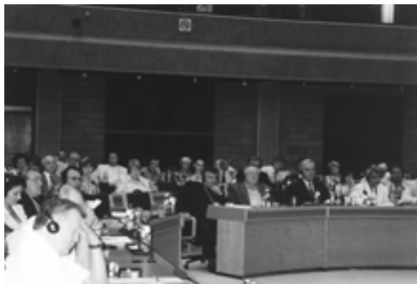
The Plenary Session of the XIV Annual Meeting of the IUE members. UN Headquarters (Nairobi, Kenya) Пленарное заседание XIV ежегодного Собрания членов МСЭ. Штаб-квартира ООН (Найроби, Кения)