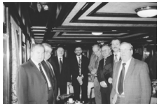
The XII Annual Meeting of the IUE members (Slovakia). Round table XII ежегодное Собрание членов МСЭ (Словакия). Круглый стол

– VI Международная встреча экономистов по теме: “Глобализация и проблемы развития” (февраль; Гавана, Куба)