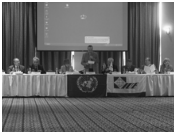
The XVII Annual Meeting of the IUE members (Aqaba, Jordan) XVII ежегодное Собрание членов МСЭ (Акаба, Иордания)

– XVII ежегодное Собрание членов МСЭ. Тема: “Энергетика будущего: экономические проблемы” (январь; Акаба, Иордания)