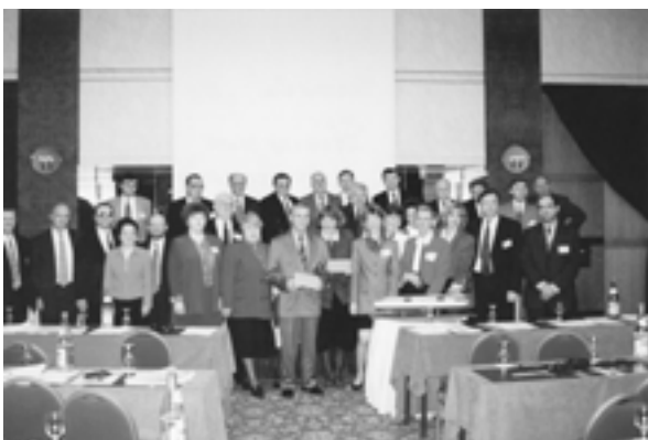
The participants of the I International Congress on Regional Development (Geneva, Switzerland) Участники I Международного конгресса по региональному развитию (Женева, Швейцария)

– The I International congress on regional development. Theme: "Business development in Russian regions: cooperation expansion after the parliamentary elections" (January; Geneva, Switzerland)