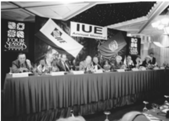
The VIII Annual Meeting of the IUE members (Limassol, Cyprus). Presidium VIII ежегодное Собрание членов МСЭ (Лимассол, Кипр). Президиум