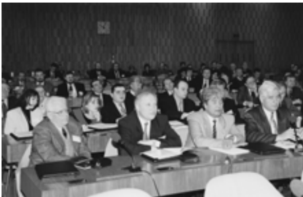
The V Annual Meeting of the IUE members – Large Conference Room, UNESCO (Paris, France) V ежегодное Собрание членов МСЭ – Большой зал заседаний ЮНЕСКО (Париж, Франция)