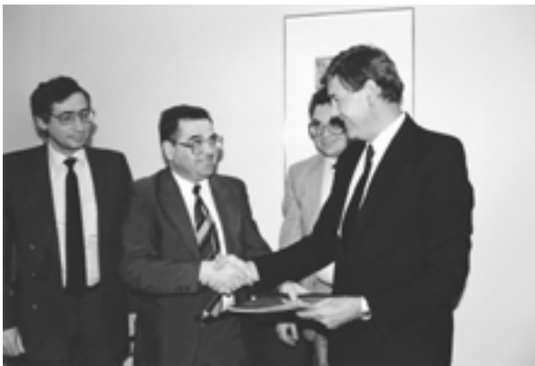
Signing the agreement on the establishment of the International project "Golden Dove" Подписание соглашения о создании международного проекта "Золотая голубка"

– Preparation of the draft agreement on realization the international project "Golden Dove" (July-August, London, Great Britain; Frankfurt, Germany; Moscow, USSR)