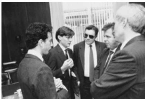
Meeting with business circles' representatives of the USA (New York) Встреча с представителями деловых кругов США (Нью-Йорк)

– Деловые встречи с ректором Колумбийского университета и представителями деловых кругов США по проблемам международного экономического сотрудничества (ноябрь; Нью-Йорк, США)