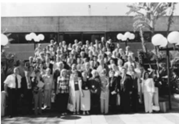
The participants of the XIV Annual Meeting of the IUE members. UN headquarters in Nairobi (Kenya) Участники XIV ежегодного Собрания членов МСЭ. Штаб-квартира ООН в Найроби (Кения)