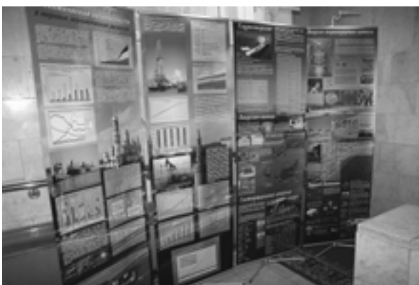
The “New Energy Sources” exhibition Выставка “Новые источники энергии”

– The IV Warsaw conference. Theme of the conference: “Prospects of development in the twenty first century – Gordian knot and Alexandrian solutions” (October; Warsaw, Poland)