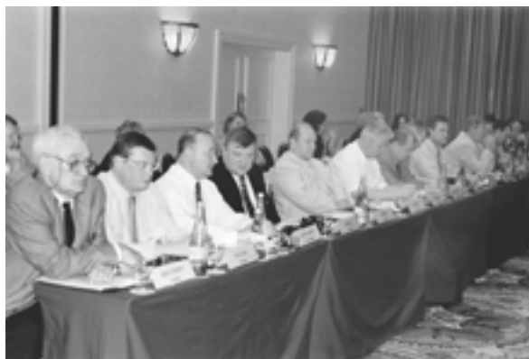
The XI Annual Meeting of the IUE members (Cape Town, South Africa) XI ежегодное Собрание членов МСЭ (Кейптаун, ЮАР)

– В рамках международного форума “Мировой опыт и экономика России” : Всероссийский экономический форум “Экономические проблемы развития городов России” (ноябрь; Москва, Россия)