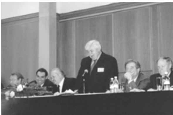
The International Congress “The Third Millennium” (Israel). A speech by the IUE President G. Kh. Popov Международный конгресс “Третье тысячелетие” (Израиль). Выступление Президента МСЭ Г.Х. Попова

– In the framework of the international forum “World experience and Russian economy” : the II All-Russian forum “Strategy of economic development of Russia – a step to the twenty first century” (November; Moscow, Russia)