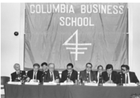
The International Conference at Columbia University (USA) Международная конференция в Колумбийском университете (США)

– Meetings with the leaders of large business firms and companies with the aim of the international business cooperation development (November; Chicago, USA)