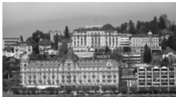
Montreux Palace Hotel – venue for the International Congress on Regional Development Гостиница "Монтрё Палас" – место проведения Международного конгресса по региональному развитию