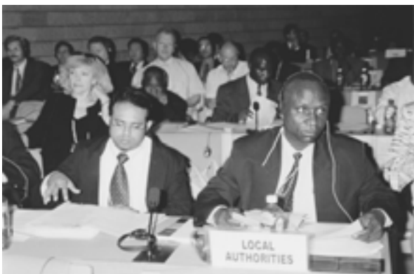
The 18 th Session of UN – HABITAT (Nairobi, Kenya) 18-я сессия ООН – ХАБИТАТ (Найроби, Кения)

– The 18 th UN – HABITAT Session, dedicated to preparation of the special session of the UN General Assembly on the theme “Human settlements and housing problem” (February; Nairobi, Kenya)