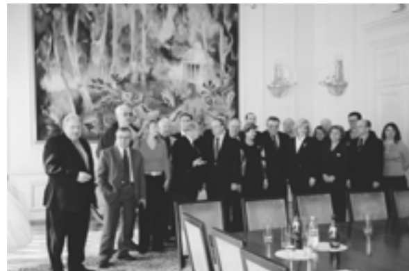
The Meeting of the IX International Congress on Regional Development participants at the Representative office of Russia in the UN (Geneva, Switzerland)

Встреча в представительстве России в ООН участников IX Международного конгресса по региональному развитию (Женева, Швейцария)