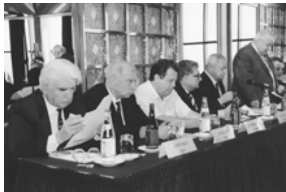
The X Annual Meeting of the IUE members (Dubrovnik, Croatia) X ежегодное Собрание членов МСЭ (Дубровник, Хорватия)

– X ежегодное Собрание членов МСЭ. Тема: “Мировая экономика и международные экономические связи” (октябрь; Дубровник, Хорватия)