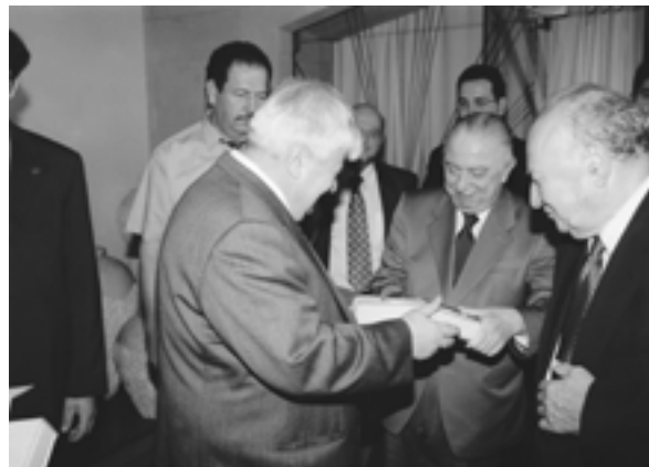
IUE President – G.Kh. Popov, the President of Cyprus – Glavkos Clerides, the Chairman of the House of Representatives – Spyros Kyprianou Президент МСЭ Г.Х. Попов, президент Кипра Главкос Клиридис, председатель палаты представителей Спирос Киприану

– Conference “Russian economy in 1998: problems and prospects of solutions” ( December; Moscow, Russia )