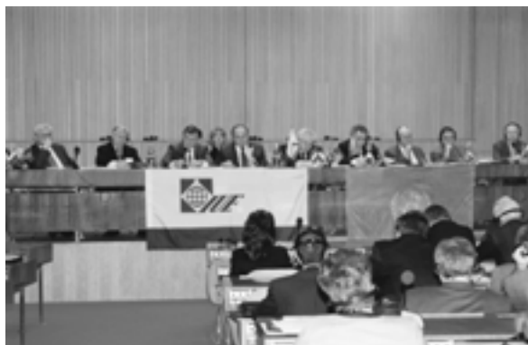
The V Annual Meeting of the IUE members (Paris, France). Presidium V ежегодное Собрание членов МСЭ (Париж, Франция). Президиум