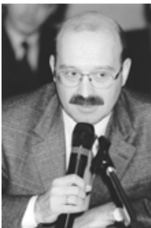
The Seminar “Russia – Argentina”. M.M. Zadornov – Deputy Chairman of Committee on Budget and Taxes, the State Russian Duma Семинар “Россия – Аргентина”. М.М. Задорнов – заместитель председателя комитета ГД РФ по бюджету и налогам

– The XI Annual Meeting of the IUE members. Theme: “Industrial and social policy in countries with transitional economy” (December; Cape Town, South Africa)