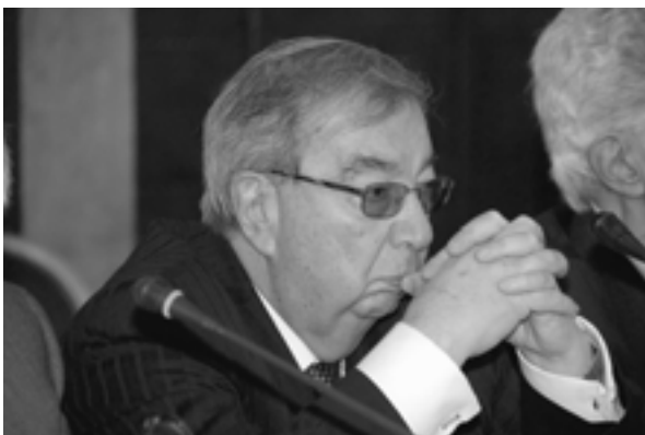
E.M. Primakov – the President of the Chamber of Commerce and Industry of the Russian Federation, academician of the Russian Academy of Sciences Е.М. Примаков – президент Торгово-промышленной палаты РФ, академик РАН