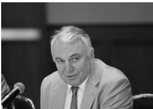
O.N. Soskovets is giving his speech Выступает О.Н. Сосковец