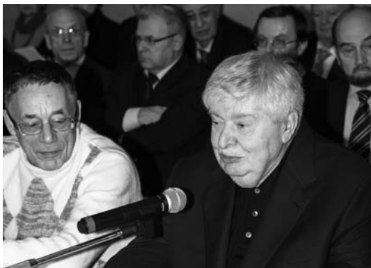
G.Kh. Popov is giving his speech Выступает Г.Х. Попов