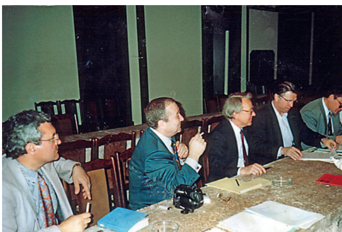
Constituent Assembly of the International Union of Economists, Sandansk (Bulgaria) – Discussion of the Charter, 1991 Учредительное собрание Международного Союза экономистов, г. Санданск (Болгария) – обсуждение Устава 1991 г.