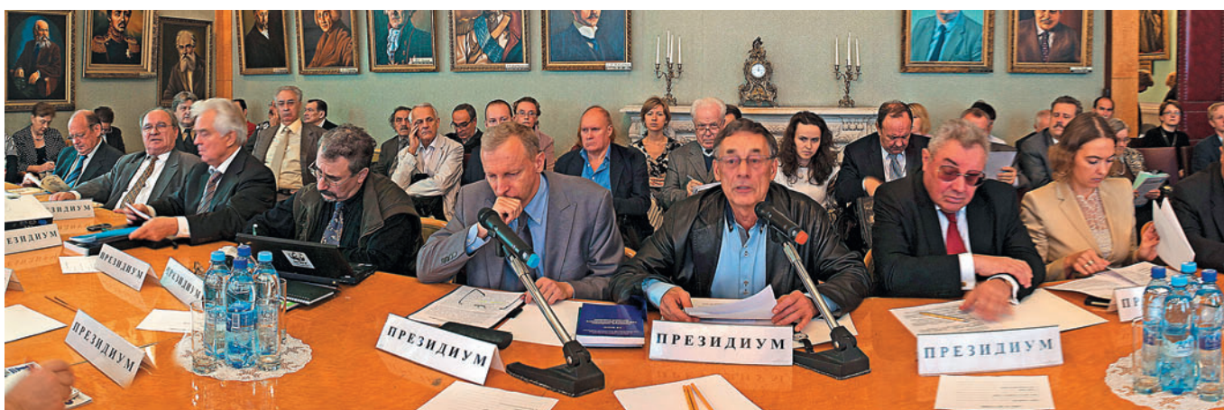
3. The participants of the Round table “Green economy: Real Facts, Prospects, and Growth Limits” Участники круглого стола «Зеленая экономика: реалии, перспективы и пределы роста»