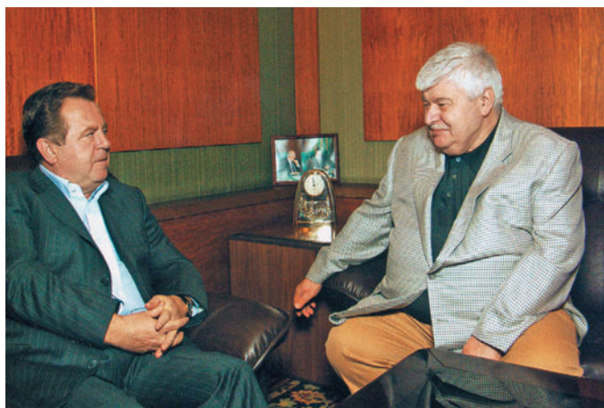
Vice-President of the IUE V.I. Shcherbakov and President of the IUE G.Kh. Popov Вице-президент МСЭ В.И. Шербаков и президент МСЭ Г.Х. Попов