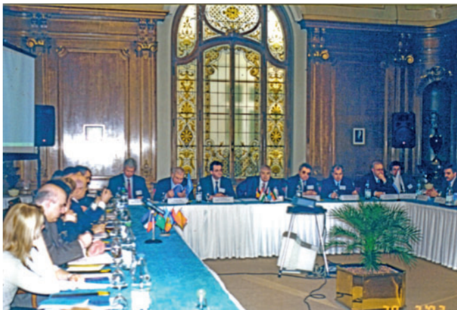
Plenary meeting of the Annual International Congress on Regional Development (Switzerland, Montreux, 2002) Пленарное заседание ежегодного Международного конгресса по региональному развитию (Швейцария, Монтрё, 2002 г.)