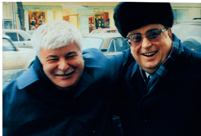
G.Kh. Popov and V.S. Pavlov at the entrance of the House of Economists in Moscow Г.Х. Попов и В.С. Павлов у входа в Дом экономиста в Москве