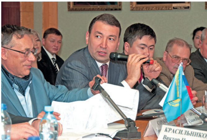
1. G.I. Orazbakov - Extraordinary and Plenipotentiary Ambassador of the Republic of Kazakhstan to the Russian Federation is giving a speech

Выступает Чрезвычайный и Полномочный Посол Республики Казахстан в Российской Федерации Г.И. Оразбаков