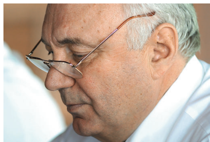
1. The Plenary Session of the XIV Annual Meeting of the IUE members. UN Headquarters (Nairobi, Kenya)

Пленарное заседание XIV ежегодного Собрания членов МСЭ. Штаб-квартира ООН (Найроби, Кения)