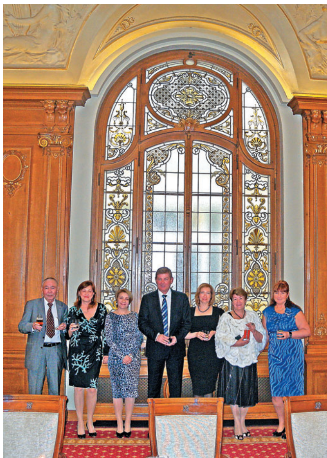
4. Participants of the Congress (Montreux, Switzerland) Участники конгресса (г. Монтре, Швейцария)