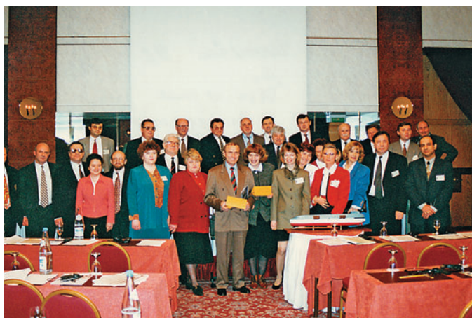
The participants of the I International Congress on Regional Development (Geneva, Switzerland)

Участники I Международного конгресса по региональному развитию (Женева, Швейцария)