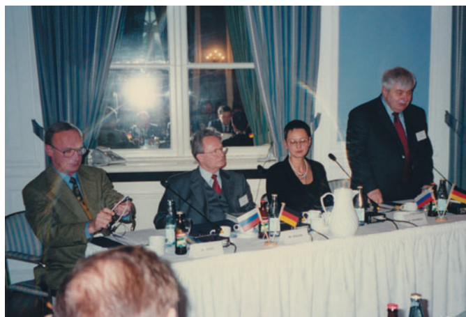
The German-Russian Round Table (Hamburg, Germany) Германороссийский круглый стол (Гамбург, Германия)