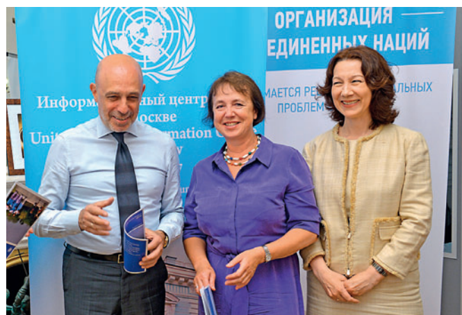
1. S.D. Bodrunov С.Д. Бодрунов