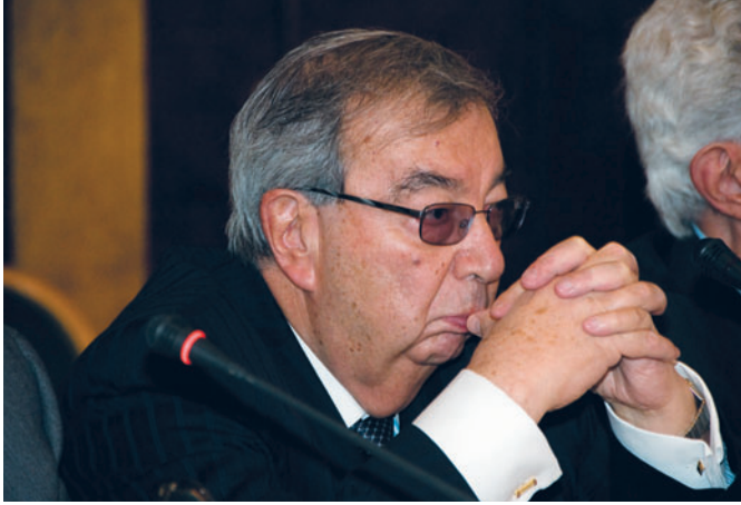
1. E.M. Primakov, the President of the Chamber of Commerce and Industry of the Russian Federation, academician of the Russian Academy of Sciences Е.М. Примаков, президент Торгово-промышленной палаты РФ, академик РАН