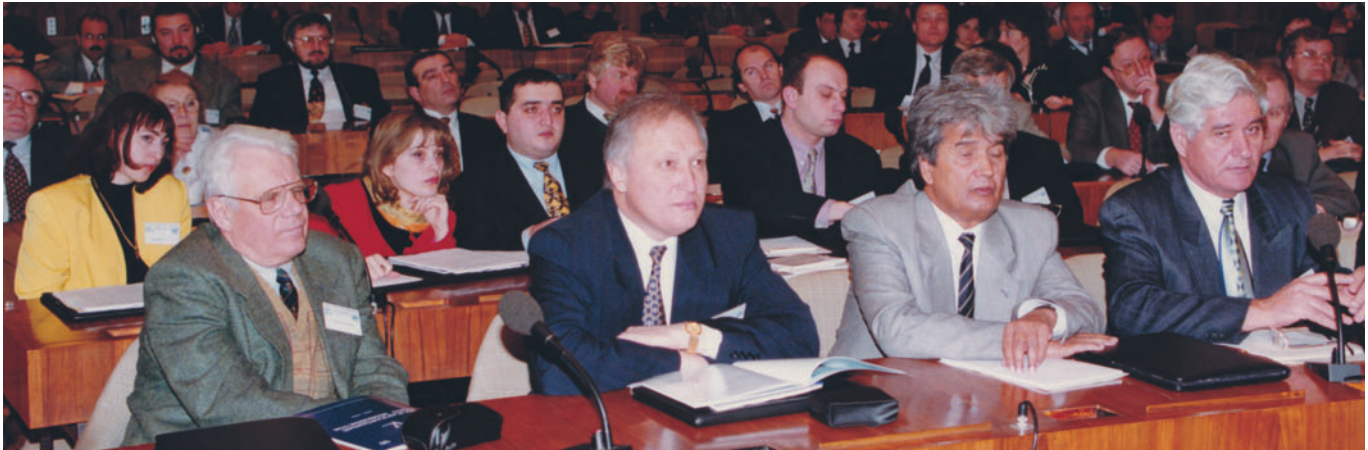
The V Annual Meeting of the IUE members – Large Conference Room, UNESCO (Paris, France) V ежегодное Собрание членов МСЭ – Большой зал заседаний ЮНЕСКО (Париж, Франция)