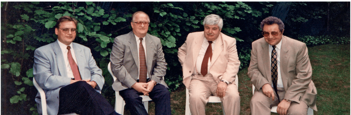
Opening the IUE mission in Luxemburg.