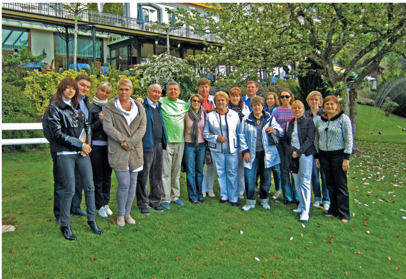
1. Participants of the 4th Astana Economic Forum Участники IV Астанинского форума