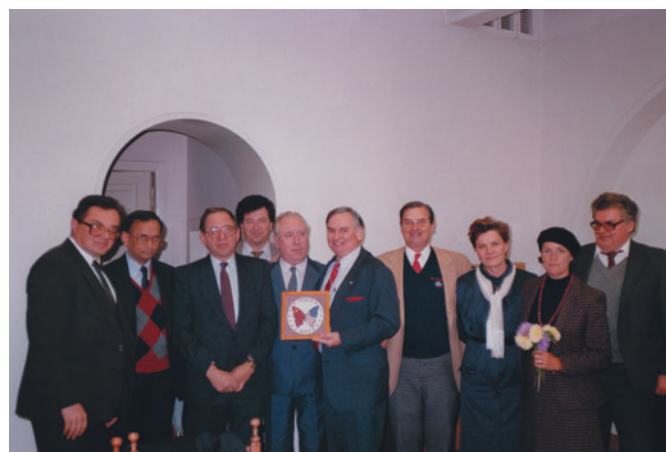
Signing the agreement on the establishment of joint venture "Amskort International"

■ Создание международного проекта «Золотая голубка» (май; Москва, СССР — Сидней, Австралия)