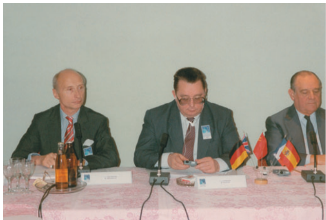
Signing the agreement on the establishment of the International project "Golden Dove" Подписание соглашения о создании международного проекта «Золотая голубка»