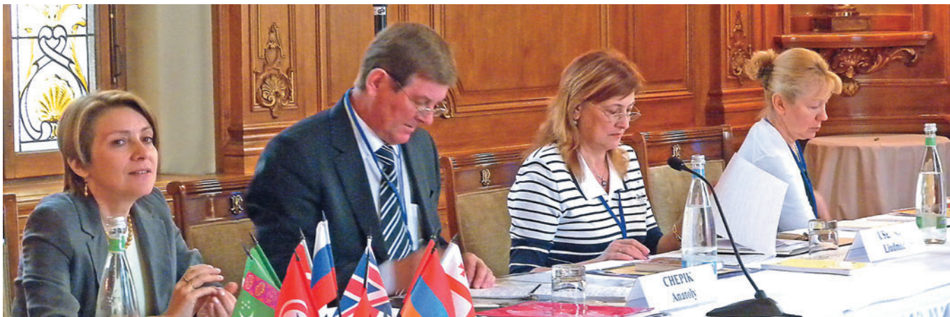
2. The participants of the Plenary Session of the 16th International Congress on Regional Development (Montreux, Switzerland) Участники пленарного заседания XVI Международного конгресса по региональному развитию (г. Монтре, Швейцария)