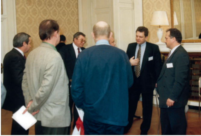
V.N.Krasilnikov, Deputy Minister of Finance of the Russian Federation V.B.Khristenko, First Deputy Mayor of Moscow in the Government of Moscow Y.V.Roslyak

В.Н. Красильников, заместитель министра финансов Российской Федерации В.Б. Христенко, первый заместитель мэра Москвы в Правительстве Москвы Ю.В. Росляк