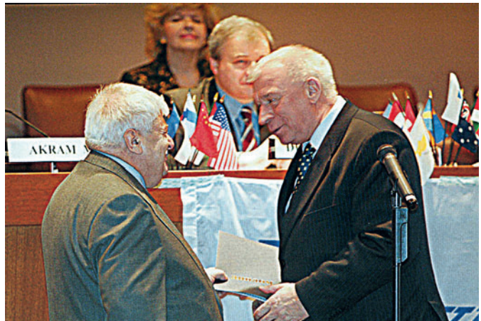
Presentation of the Diploma of the IUE Vace-President O.M. Tolkachev (USA, 2006) Вручение диплома вице-президенту МСЭ О.М. Толкачеву (США, 2006 г.)