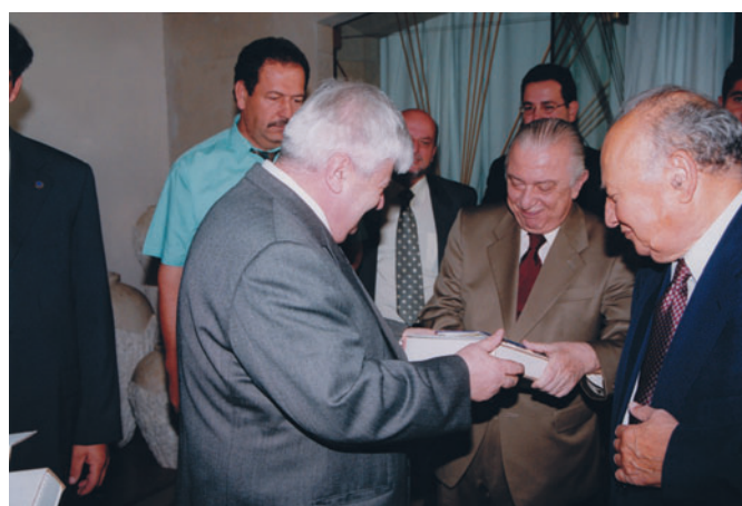
IUE President – G.Kh. Popov, the President of Cyprus – Glavkos Clerides, the Chairman of the House of Representatives – Spyros Kyprianou Президент МСЭ Г.Х. Попов, президент Кипра Главкос Клиридис, председатель палаты представителей Спирос Киприану