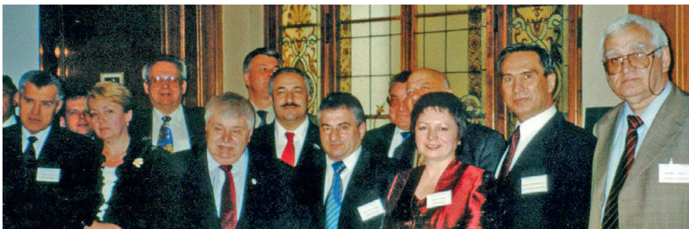
IUE President G.Kh. Popov with the participants of the Congress (Switzerland, Montreux, 2002) Президент МСЭ Г.Х. Попов с участниками конгресса (Монтрё, Швейцария, 2002 г.)