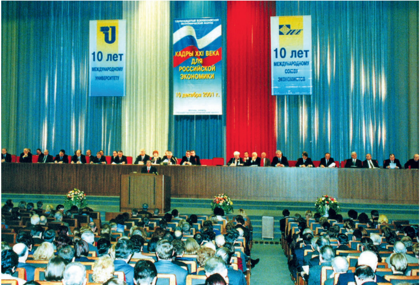
10 years of the International Union of Economists. Economic Forum in the Kremlin, 2001 10-летие Международного Союза экономистов. Экономический форум в Кремле, 2001 г.