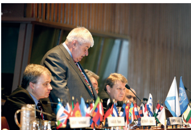
G.Kh. Popov is giving a speech. Anniversary Meeting – 15 years of the IUE (USA, New York, UN, 2006) Выступает Г.Х. Попов. Юбилейное собрание МСЭ – 15 лет (США, Нью-Йорк, ООН, 2006 г.)