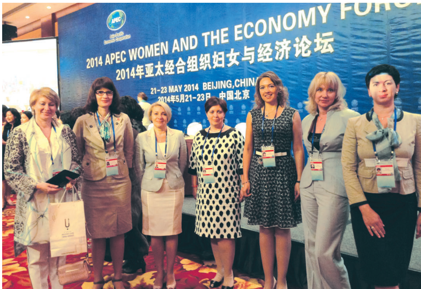
1. Participants of the APEC "Forum Women and Economy" (Beijing, China)

Участники форума АТЭС «Женщины и экономика» (Пекин, КНР)