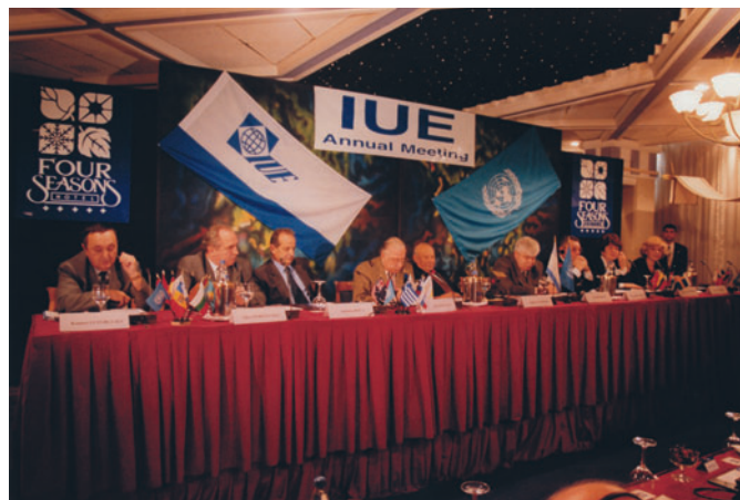
1. The VIII Annual Meeting of the IUE members (Limassol, Cyprus). Presidium

VIII ежегодное Собрание членов МСЭ (Лимассол, Кипр). Президиум