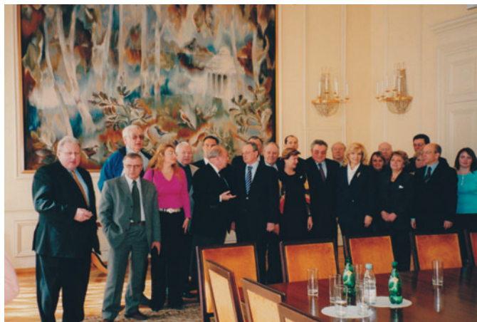
The Meeting of the IX International Congress on Regional Development participants at the Representative office of Russia in the UN (Geneva, Switzerland)

Встреча в представительстве России в ООН участников IX Международного конгресса по региональному развитию (Женева, Швейцария)