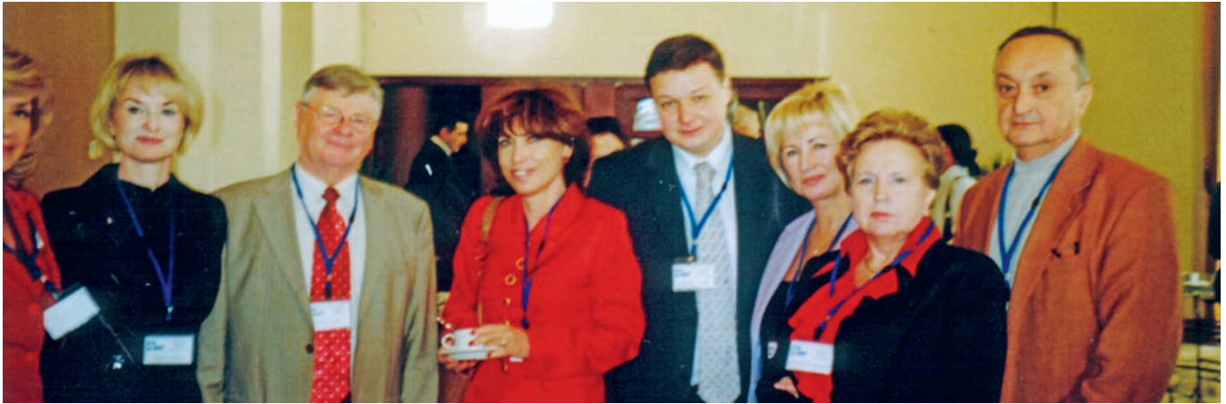
The participants of the IUE Annual Meeting in Aqaba (Jordan, 2008)