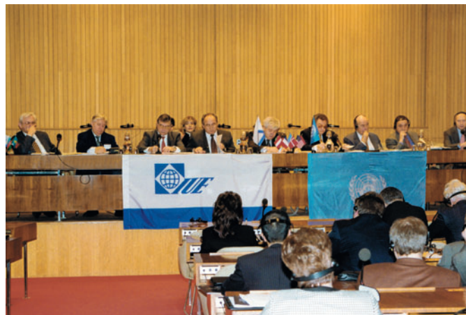
The V Annual Meeting of the IUE members (Paris, France). Presidium

V ежегодное Собрание членов МСЭ (Париж, Франция). Президиум