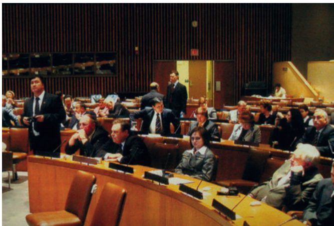
Participants of the XV IUE Meeting (USA, UN, the hall №1, 2006) Участники XV Собрания членов МСЭ (США, зал №1 ООН, 2006 г.)