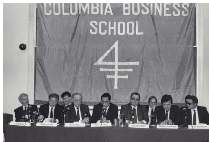
Meeting with business circles' representatives of the USA (New York)

Встреча с представителями деловых кругов США (Нью-Йорк)