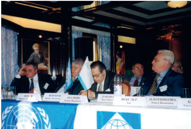
IUE Annual Meeting. IUE Director General V.N. Krasilnikov, IUE President G.Kh. Popov, IUE Vice-President, academician of the Russian Academy of Sciences L.I. Abalkin, IUE Vice-President L. Veksler (Germany, 2003) Ежегодное собрание МСЭ. Генеральный директор МСЭ В.Н. Красильников, президент МСЭ Г.Х. Попов, вице-президент МСЭ, академик РАН Л.И. Абалкин, вице-президент МСЭ Л. Векслер (Германия, 2003 г.)