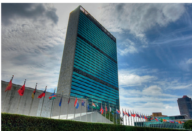
UN Building Здание ООН