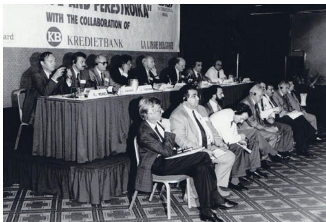
The International Colloquium (Brussels, Belgium) Международный коллоквиум (Брюссель, Бельгия)