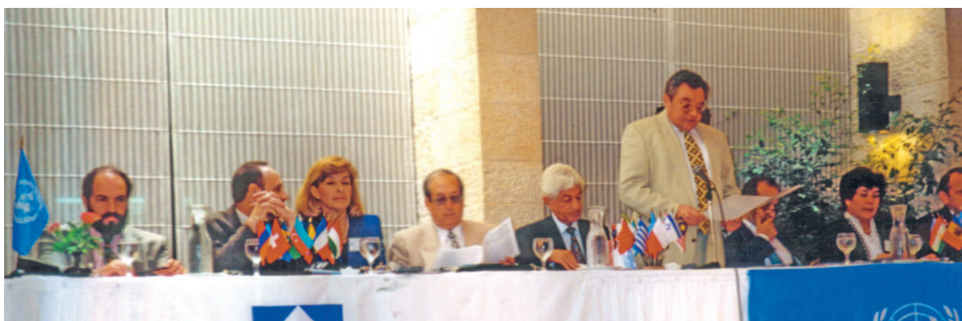
IUE Annual Meeting in Tel Aviv (Israel, 1997) Ежегодное Собрание МСЭ в Тель-Авиве (Израиль, 1997 г.)