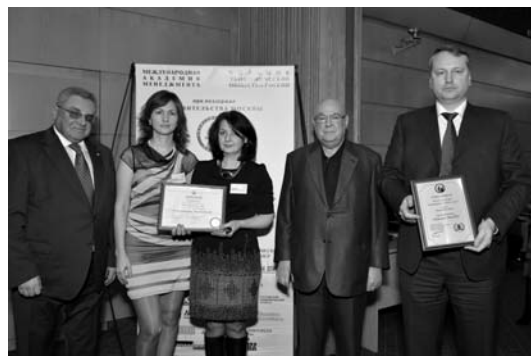
Awarding ceremony for Group of companies Etalon MosTU (in the Team of the Year nomination) Награждение Группы компаний «Эталон» МосТУ (в номинации «Команда года»)