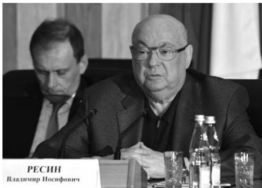
V.I. Resin is giving his speech Выступает В.И. Ресин

Head of the Jury is member of the State Duma Federal Assembly of the Russian Federation V.I. Resin .