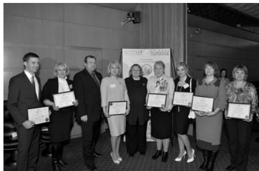
Winners of the contest Победители конкурса

Стратегический партнер — Медиа группа «Наша власть».