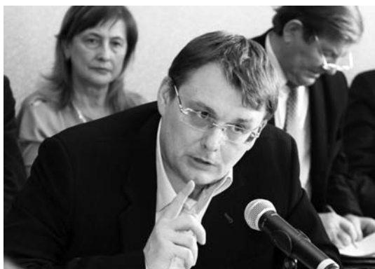
E.A. Fyodorov is giving his speech Выступает Е.А. Фёдоров

Evgeny Alekseevich Fyodorov — member of the Presidium of the VEO of Russia, member of Budget and Taxation Committee of the State Duma of the Federal Assembly of the Russian Federation, Cand. Sc. (Economics) — spoke on Methods of Economic Development of the Far East. One of the tools of rectifying economic situation in the country, which recently has been demonstrating a sharp decrease of growth rates, is a decreased credit interest rate. In the context of international practice, it is not possible to deny that the main driver for positive dynamics of national economy of any state is an efficient financial policy and that is why a decreased interest rate for crediting the investment projects including those for the Far East would enhance stability of national economy.