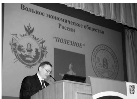
S.D. Bodrunov told those present about the jubilee events dedicated to 250th Anniversary of the VEO of Russia С.Д. Бодрунов рассказал о юбилейных мероприятиях, посвященных 250-летию ВЭО России

The First Saint Petersburg International Congress on Economic Policy with its main subject being Foresight «Russia»: Design of New Industrial Policy took place on March 23, 2015 at the Saint Petersburg State University of Economics.