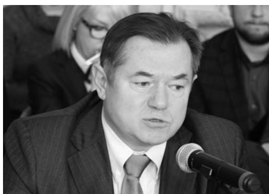
S.Yu. Glaziev is giving his speech Выступает С.Ю. Глазьев