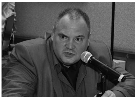
K.S. Teteryatnikov is giving his speech Выступает К.С. Тетерятников

Kyryll Semyonovich called for recognition of the fact that low inflation does not lead to economic growth automatically and inflation targeting is not the main goal for the developed countries but just a means of achieving economic growth. He also noted that quantitative easing programs in a number of countries proved to be inefficient and he confirmed that a low rate discontinues development. K.S. Teteryatnikov summarized his address by several theses: