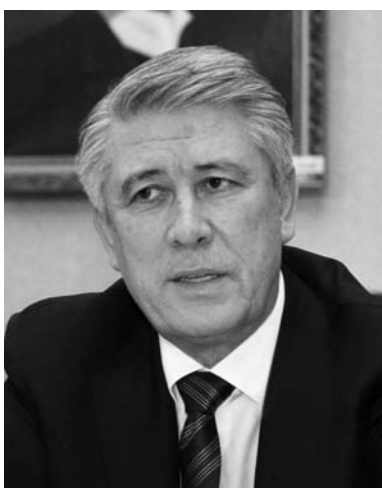
M.A. Eskindarov is giving his speech Выступает М.А. Эскиндаров

M.A. Eskindarov pointed out the military-industrial complex with its multiplicative effect as the branch capable of drawing the Russian economy out of the crisis. Also large infrastructural projects gain special importance in terms of economy development. The expert believes that in the context of today's Russian reality the support for small and mid-sized businesses, in accordance with the pattern similar to that used by economically developed states during crisis, won't be efficient and will fail to produce a significant effect on the country's economy in general. «I don't mean that we shouldn't provide support to small and mid-sized businesses, but today we firstly need to support large enterprises which in turn will attract money in small companies as well», underlined the Rector of the Financial University.