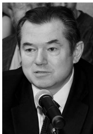
S.Yu. Glaziev is giving his speech Выступает С.Ю. Глазьев

Борьба с инфляцией монетаристскими методами в предпосылке того, что экономика может быть «перегрета», привела к сегодняшней рыночной ситуации. «Это прямой результат политики ЦБ РФ по повышению процентных ставок, чем был отрезан финансовый сектор от реального» — считает советник Президента Российской Федерации. Политика ЦБ РФ привела к «раскрутке» инфляции и «сжатию» производства.