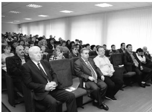
The participants of the conference Участники конференции