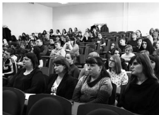
The participants of the conference Участники конференции

5 февраля 2015 года в Ставропольском государственном аграрном университете состоялась V Международная научно-практическая конференция «Аграрная наука, творчество, рост». В конференции традиционно приняли участие следующие факультеты: учётно-финансовый, агробиологии и земельных ресурсов, экологии и ландшафтной архитектуры. Основные задачи — научное развитие молодых ученых и знакомство с новыми практико-ориентированными исследованиями в разных областях науки и практики.